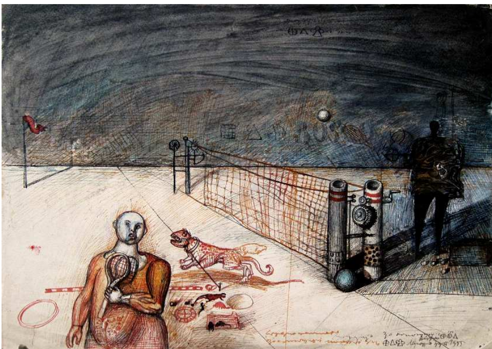
Dado, Sans titre (cours de tennis à Cetinje) , 1955. Encre et lavis sur papier, 29 x 42 cm, Collection de Diotime, petite-fille de Dado.