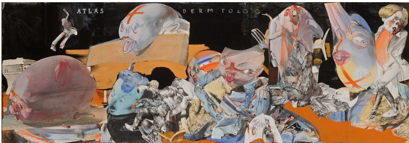
Dado, Atlas de Dermatologie , 1975. Collage contrecollé sur bois, 87 × 250 cm.