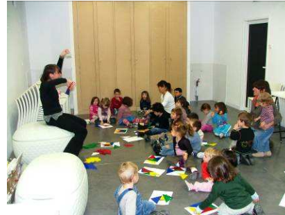
Visite – atelier au Musée dans le cadre du service éducatif