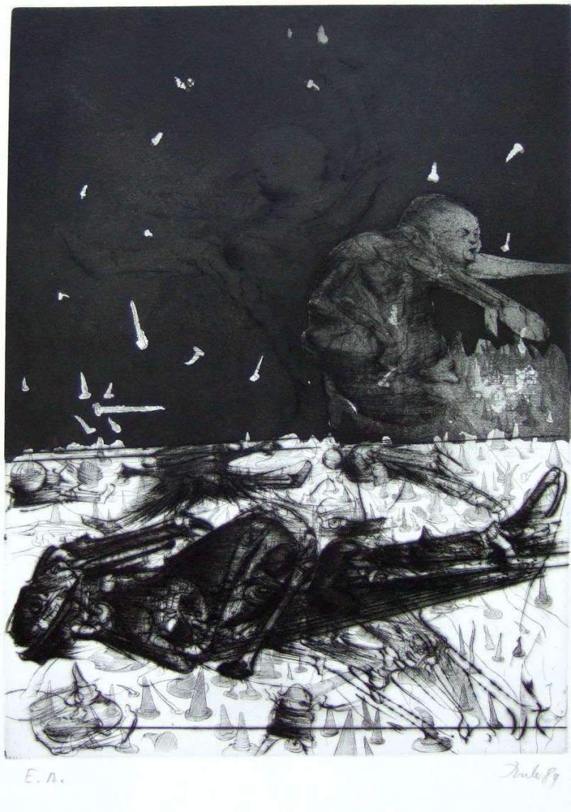
Dado, Barbey d'Aureilly, « Le Bonheur dans le crime » , 1989. Aquatinte et pointe sèche, 38 x 56 cm