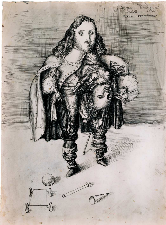
Dado, Colloredo , 1955. Encre et lavis d'encre sur papier, 47 × 35 cm. Ancienne collection Jernej Vilfan, collection particulière.